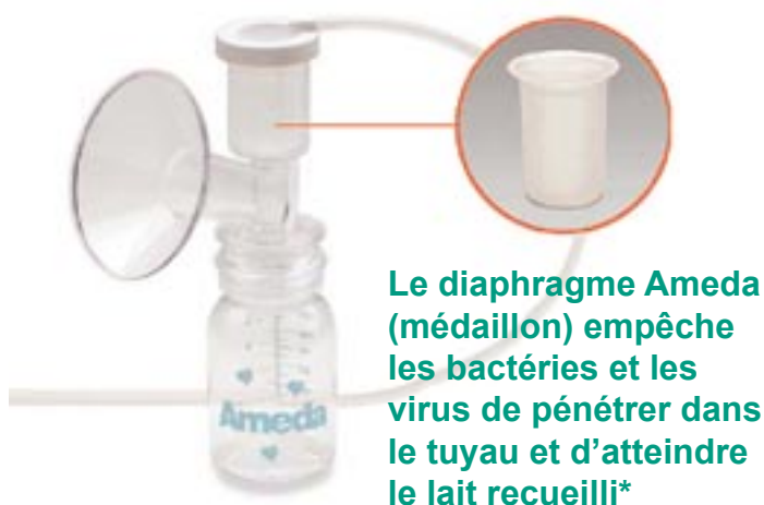
Le diaphragme Ameda (médaillon) empêche les bactéries et les virus de pénétrer dans le tuyau et d'atteindre le lait recueilli*